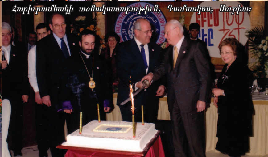
Հարիւրամեակի տօնակատարութիւն, Դամասկոս, Սուրիա: