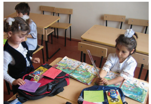
Նորաշէնի աշակերտները ՀԲԸՄի նուիրած գրեկական պիտոյքները կ'օգտագործեն

ՀԲԸՄը կը շարունակէ հովանաւորել վեց Տարեցներու Հաշարահներ, որոնք Հայաստանի անկախացումէն ետքը հաստատուեցան Երեւանի, Սեւանի, Էջմիածնի եւ Հրազդանի մէջ: Ատոնք օրական տաք մաշ կը հայթայթեն աւելի քան 1,200 թոշակատուներու եւ որբերու: Բաժինները միշտ բաւարար են, այնպէս որ ընդունողները մաշէն աւելցածը տուն կը տանին ընտանիքի այլ անդամներու եւ քարեկամներու համար: Ասկէ գատ, կամաւոր աշխատողներ կերակուր կը տանին հիւանդներուն եւ տունէն դուրս գալու անկարող անձերուն: