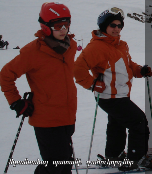
Ֆրանսահայ պատանի դահուկորդներ

Տարուէ տարի, ՀԲԸՄի րազմաթիւ երիտասարդաց մարմիններ յանձնառութիւն կը ցուցաբերեն իրենց ինքնուրուի պահպանելու, քաջախելու եւ զարգացնելու: