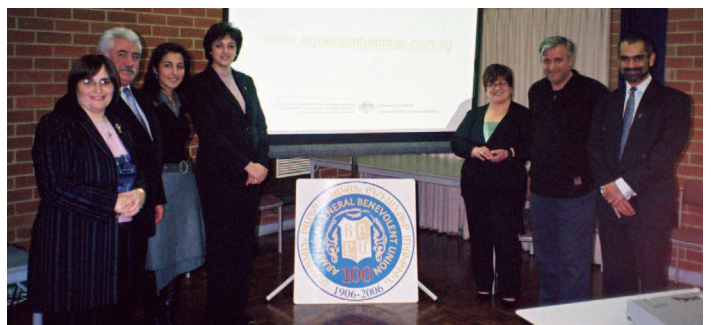
Ապրիլ 25, 2006ին, ՀԲԸՄ Մեկուտոնի Մասնաճյուղը Հայկական ժառանգութեան Կեդրոնի բացումը կատարեց: