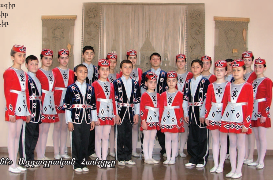
ՀԲԸՄԻ Նոր՛ Հայորդեաց Կեդրոնի «Հայկագունի» Ազգագրական Համոյթը

Ահազանգ Թատերախումբ (Փարիզ, Ֆրանսա) Արտաւագդ Թատերախումբ (Գալիֆորնիա, ԱՄՆ) Պետրոս Աղամբան Թատերախումբ (Հալէպ, Սուրիա) Թատերախումբ (Թորոնթօ, Գանատա) Վահրամ Փափագեան (Անթիլիաս, Լիբանան) Երիտասարդաց Թատերախումբ (Համբուլ, Պուլկարիա)