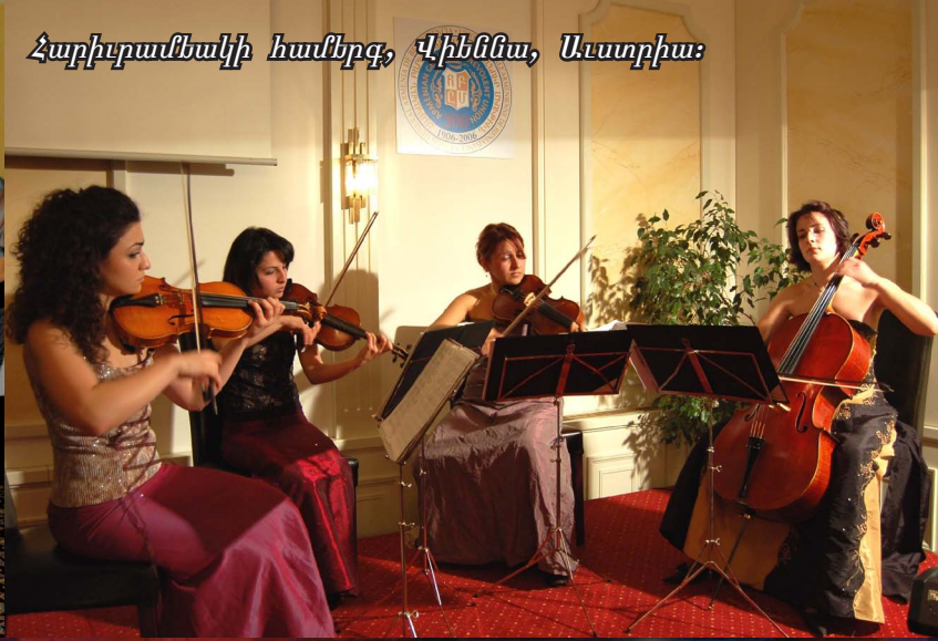
Հարիւրամեակի համերգ, Վիեննա, Աւստրիա: