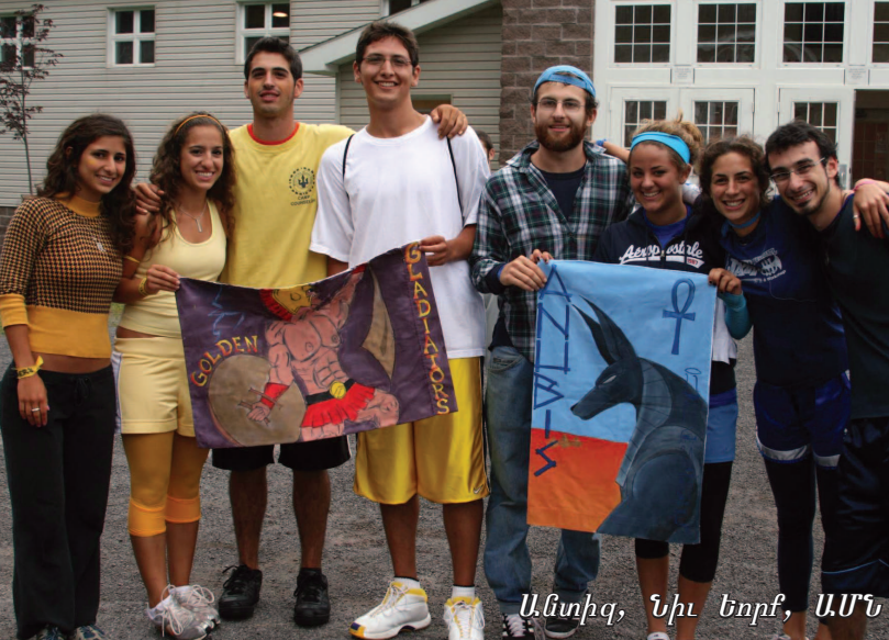
Անտիգ, Նիւ Եորք, ԱՄՆ