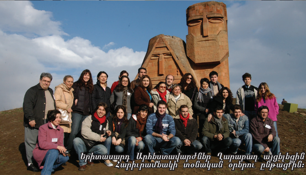
Երիտասարդ Արհեստավարժներ Դարարդ այցելեցին Հարիւրամեակի տօնակալ օրերու ընթացքին: