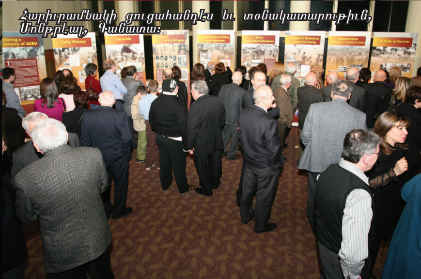
Հարիւրամեակի ցուցահանդէս եւ տօնակատարութիւն, Սինթրէպ, Գանատա: