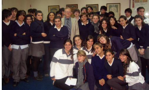
Դամասկոսի Կիլլայի Կիլպէնկեան Վարժարան

ոչ հայկական դպրոցներ՝ ապագայի համար յաջողութեան առաւել կարելիութիւններ ապահովելու համոզումով: Այս իրողութիւններու դիմագրասումը կ'ենթադրէ նոր աշխատելաձեւերու որդեգրում եւ կազմակերպչական համապատասխան կառոյցներ, որոնք դրսեւորուեցան Կրթական Բաժնի Տնօրէնի պաշտօնին ստեղծումով, զորս ստանձնեց Պրն. Արթուն Համալեան եւ Կրթական Խորհրդատու Յանձնախումբով, որուն մասնակցելու հրաւիրուեցան կրթական մարզէն ներս լայն եւ բազմաբնոյթ փորձառութիւն ունեցող մասնագէտներու խումբ մը: