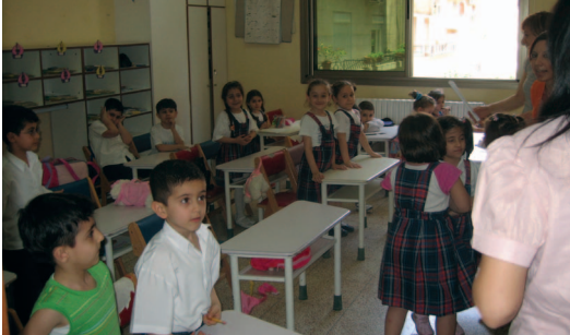
Հալէպի Լազար Նանարեան-Գալուստ Կիլպէնկեան Վարժարան