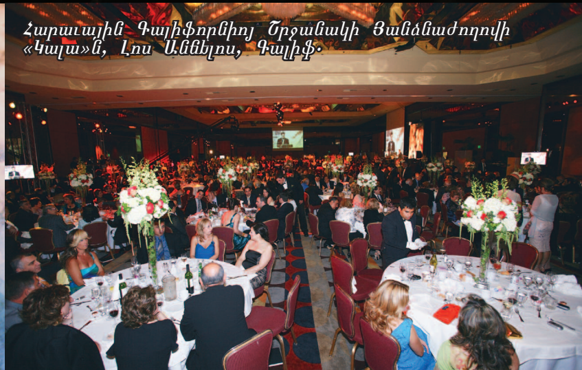
Հարաւային Գայիֆորնիոյ Շրջանակի Յանձնաժողովի «Կալա»-ն, Լուս Աննելոս, Գայիֆ: