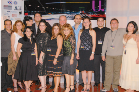
ԵԱԻ Լոս Անճելոս