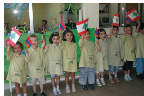
Պէյրուքի Պօղոս Գ. Կարմիրեան Վարժարան