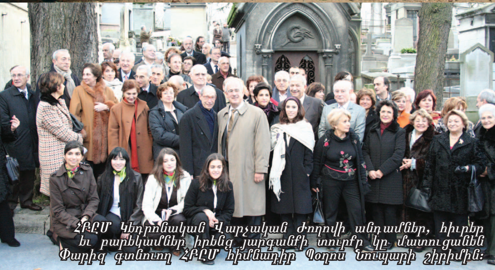
ՀԲԸՄ Կեդրոնական Վարչական Ժողովի անդամներ, հիւրեր եւ բարեկամներ իրենց յարգանքի տուրքը կը մատուցանեն Փարիզ գտնուող ՀԲԸՄ հիմնադիր Պօղոս Նուպարի շիրիմին: