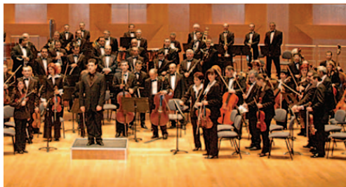
ՀԲԸՄի կողմէ ֆինանսատրուած Հայկական Ֆիլիհարմոնիկ Նուագախումբը

Հայաստանի Ֆիլիհարմոնիկ Նուագախումբը (ՀՖՆ), որ 1992էն ի վեր ՀԲԸՄի հովանավորութիւնը կը վայելէ, իր 80ամեակը տօնեց Յունիս 8, 2006ին տեղի ունեցած յատուկ համերգով: Այս ուղեւորին տարեդարձի առթիւ, հիւր կատարողներ և ղեկավարներ հրախորհեցան Ֆրանսայէն, Գերմանիայէն, Իտալիայէն, Հավիտէն, Ռուսիայէն, Զուիցերիայէն և ԱՄՆէն՝ ՀՖՆի կողմէ ներկայացուած համերգներուն իրենց մասնակցութիւնը բերելու: Յունիս 2006ին, նուագախումբը շարաք մը անցուց Մոսկուա և համերգներ տուաւ: ՀՖՆը համերգներ տուաւ նաեւ Նուրեմպերկ, Գերմանիա- Պրաթիսլավա, Սլովաքիա և Չեխ հանրապետութեան երկու մեծագոյն քաղաքներ՝ Փրախա և Պրնո, Սեպտ. ու Հոկտ. 2006ին տեղի ունեցած երաժշտական փառատօններու ընթացքին: Փետրուար 2007ին, 110-հոգեկոց այս նուագախումբը Ֆրանսա գնաց և տեղական ՀԲԸՄի մասնակցութիւնը կողմէ կազմակերպուած հիւրախաղային համերգներ տուաւ Լիոն, Մարսէյ, Նիս, Փարիզ, Սէն Էթիէն, Վալանս և այլուր, որոնք մաս կը կազմէին այդ երկրի «Հայաստանի Տարի» կոչուող տօնակատարութեանց: