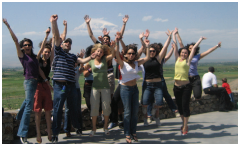
Երեւանի Ասպարէզային Փորձառութեան Ամառնային Ծրագիր