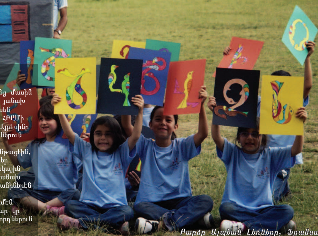
Բարձր Ալպեան Լեռները, Ֆրանսա

Ֆրանսայի Շրջանակն ալ, ամէն ճմեռ մէկ շարաթ տնող նամբար կը կազմակերպէ պատանի դահուկորդներուն համար: