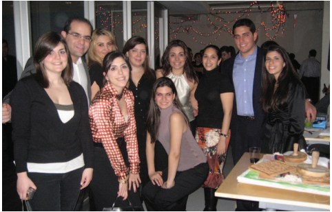
ԵԱԻ Մեծագոյն Նիւ Եորք