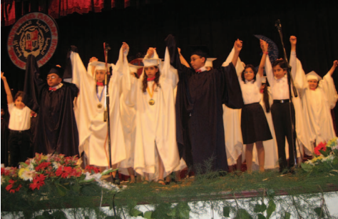
Պուէնոս Այրէսի Մարի Մանուկեան Վարժարան