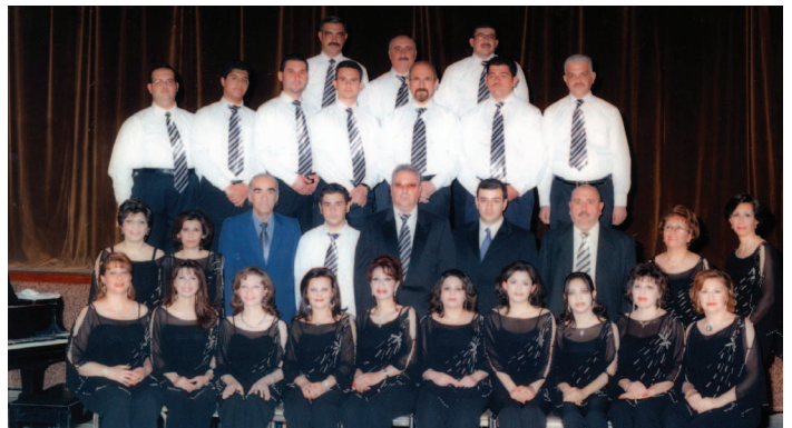
ՀԲԸՄ Պաղատտի «Սպայթ Նովա» երգչախումբը կը պատրաստուի ելոյթ ունենալ ՀԲԸՄի կեդրոնէն մերս Նոյեմբեր 18, 2006ին, 500 ունկնդիրներու ներկայութեամբ: