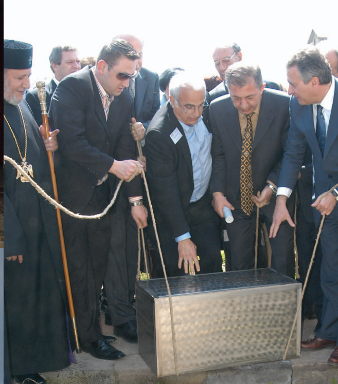
Ապրիլ 8, 2007ին, Սր. Զատկուայ արարողութիւններէն ետք, ՀԲԸՄ Հարիւրամեակի ժամանակապատինը, որ 2106ին միայն բացուելու է, բաղունցաւ Սր. Էջմիածնի հողին մէջ: ՀԲԸՄի անդամներ Հայաստան կը գտնուէին՝ Միութեան 100 ամեակի նշանակալիչ տօնակատարութեանց մասնակցելու համար: