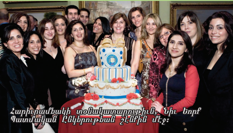
Հարիւրամեակի տօնակատարութիւն, Նիւ Եորք Պատմական Ընկերութեան շէնքին մէջ:

Հարիւրամեակի ուշագրաւ ձեռնարկներ տեղի ունեցան Միութեան ծննդավայր՝ Գահիրէի, Վերայի Պալատին, ինչպէս նաեւ Հայաստանի եւ Ղարաբաղի մէջ, ուր յորելիական հանդիսութիւններով վերջ գտան ՀԲԸՄի դարադարձի տօնակատարութիւնները: