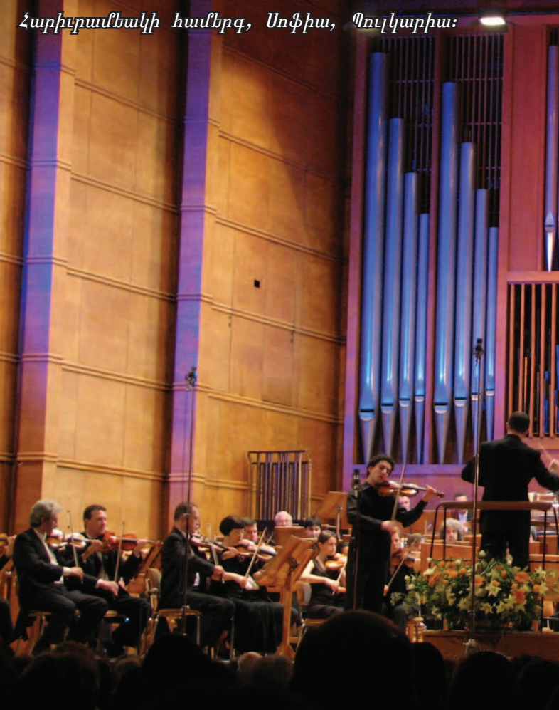
Հարիւրամեակի համերգ, Սոֆիա, Պուլկարիա: