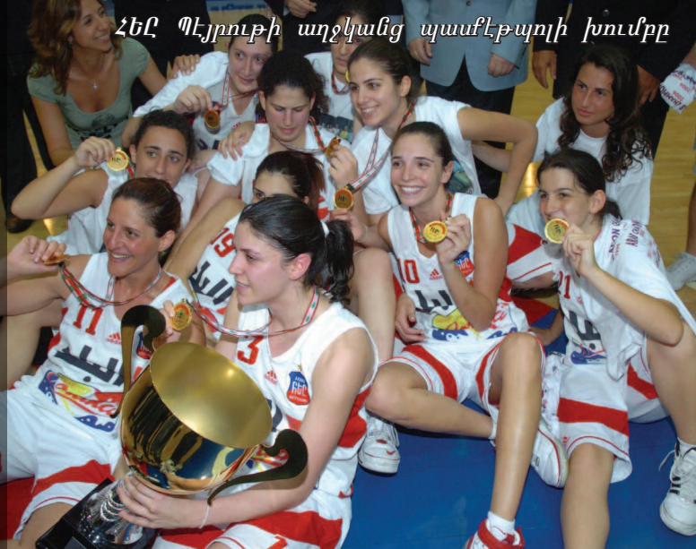
Չէ՛ր Պէյրութի աղջկանց պատւէպօլի խումբը

Ինչպէս անցեալին, Հիւսիսային եւ Հարաւային Ամերիկաներուն մէջ շրջանային խաղեր շարունակուեցան աւելի ոգեւորութեամբ քան երբեքէ՛ր: Այս վերջին երկու տարիներու ընթացքին միայն ի մի բերելով աւելի քան հազար հայ երիտասարդ-երիտասարդուհիներ չորս տարբեր ֆաղաֆներու մէջ: Մոնթէվիտէօ (2006) եւ Սան Փաուլօ (2007) հիւրընկալեցին տարեկան Հարաւային Ամերիկեան Խաղերը, երեք տասնեակ տարիներու սանդուքիւն մը այս ցամաքաբաժնի վրայ: Եւ առաջին անգամ ըլլալով բազում տարիներու ընթացքին, Լոս Անճելոսէն ՀԲԸՄի խումբեր մասնակցեցան կիսամեայ Գանատական Խաղերուն, որոնք տեղի ունեցան Թորոնթոյի մէջ Յուլիս 4ի երկար շաբաթավերջի ընթացքին: