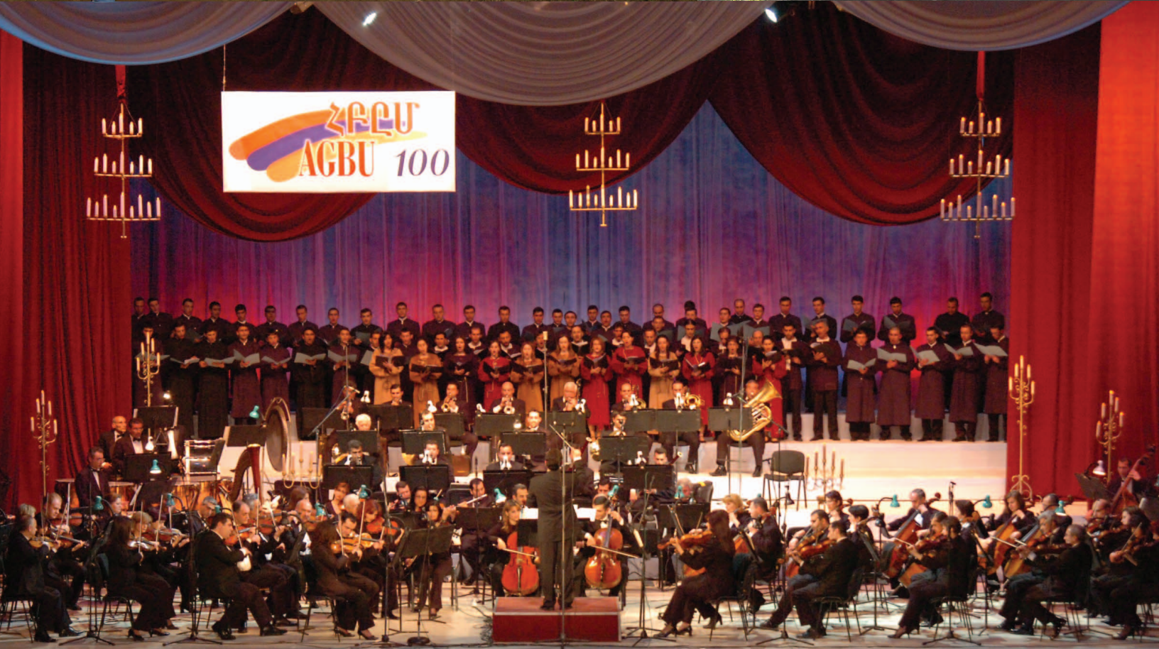
ՀԲԸՄի կողմէ հովանաւորած շքեղ համերգ, Ապրիլ 8, 2007, Երևանի Օփերայի շէնքը: