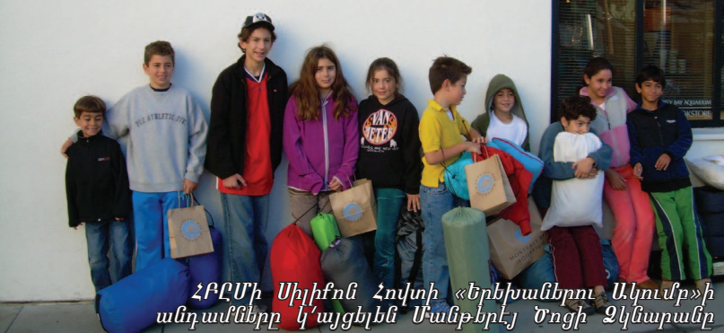
ՀԲԸՄի Սիլիքոն Հովիտի «Երեխաներու Ակումբ»-ի անդամները կ'այցելեն Մանթերէյ Ծոցի Զկնարանը