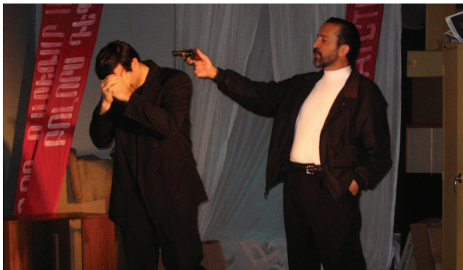
«Վարձկան Մարդասպանը» թատերախաղին ներկայացումը Թորոնթոյի մէջ