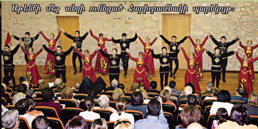
Աբէննի մէջ տեղի ունեցած Հարիւրամեակի պարերէրթ: