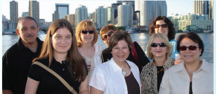
Օնթարիո Լիմի վրայ նաւապոյտ ի նպաստ Նոր Զրարերդի Վերանակեցման Ծրագրին: