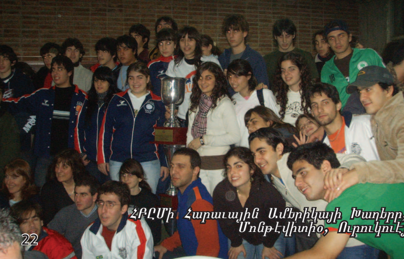
ՀԲԸՄի Հարաւային Ամերիկայի Խաղերը, Մոնթէվիտէօ, Ուրուկուէյ