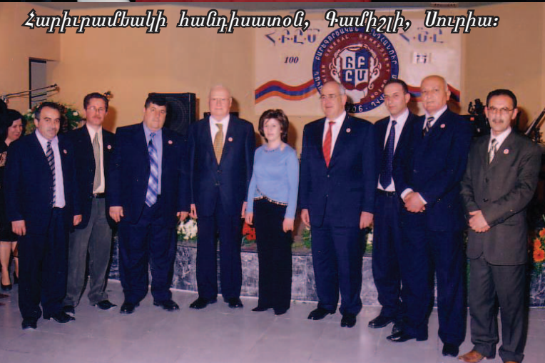
Հարիւրամեակի հանդիսատօն, Գամիշլի, Սուրիա: