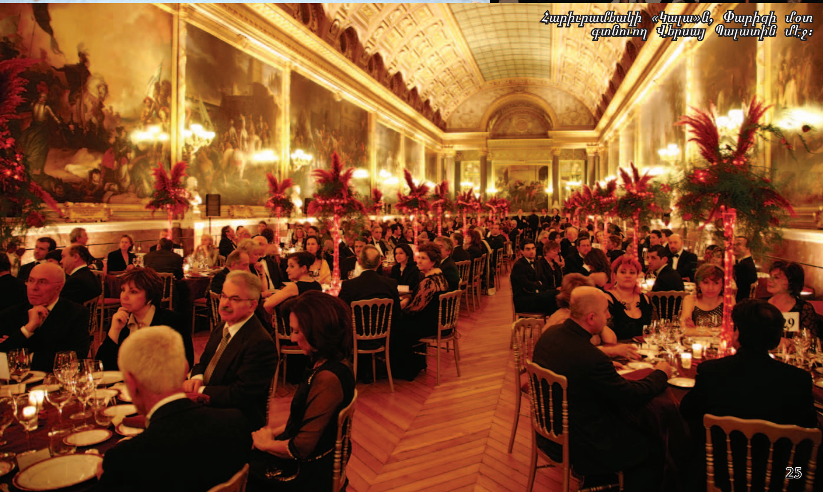
Հարիւրամեակի «Կալա»ն, Փարիզի մօտ գտնուող Վերսայ Պալատին մէջ: