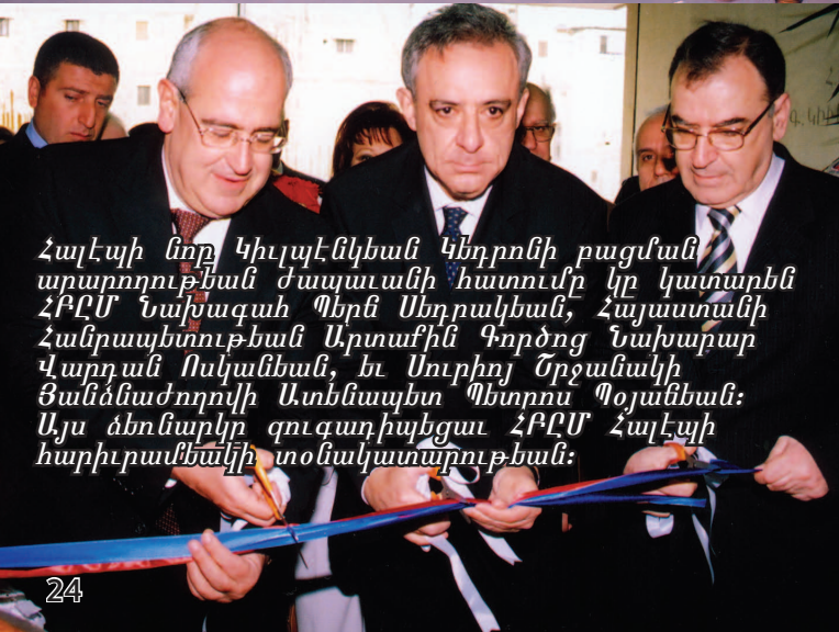
Հալէպի նոր Կիւլպէնկեան Կեդրոնի բացման արարողութեան ժայտաւանի հատումը կը կատարեն ՀԲԸՄ Նախագահ Պեր Սեդրակեան, Հայաստանի Հանրապետութեան Արտաքին Գործոց Նախարար Վարդան Ոսկանեան, եւ Սուրիոյ Շրջանակի Յանձնաժողովի Ատենապետ Պետրոս Պոյանեան: Այս ձեռնարկը զուգահիշեցաւ ՀԲԸՄ Հալէպի հարիւրամեակի տօնակատարութեան: