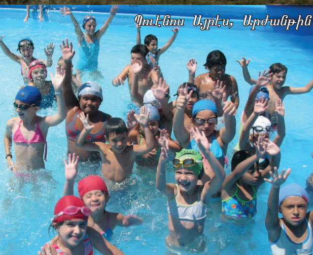
Պուէնուս Այրէս, Արժանթին