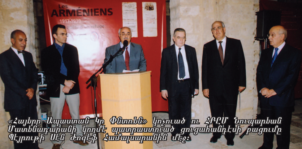
«Հայերը Ապաստան կը Փնտռեն» կոչում ու ՀԲԸՄ նույնպիսի Մատենադարանի կողմէ պատրաստուած ցուցահանդէսի բացումը Պէրուի Սէն ժոզէֆ Համայնարանին մէջ: