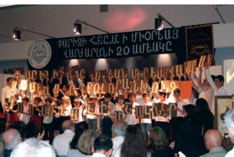
Փարիզի Ալեք Մանուկեան Շարաքօրեայ Վարժարան

Անցեալ երկամեայ ժամանակաշրջանին ձեւ առաւ նաեւ իր տեսակին մէջ եզակի նախաձեռնութիւն մը՝ համացանցի դրութեամբ գործադրելի լեզուամշակութային ծրագիրը՝ (AGBU Virtual College): Արդէն պատրաստութեան ընթացքի մէջ է վեց լեզուներով եռամեայ դասընթացը, որ կ'ընդգրկէ հայ լեզուի, պատմութեան եւ մշակոյթի որակաւորեալ դասանիւթեր: