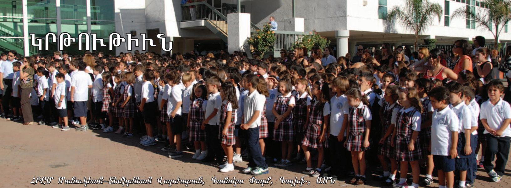
ՀԲԸՄ Մանուկեան-Տեմիրեան Վարժարան, Գանդակ Փարք, Գալիֆ., ԱՄՆ

Անցնող տասնամյակներուն, Հայկական Բարեգործական Աւելանալուր Միութեան կրթական գործունէութիւնը դրսեւորուած է դպրոցներու եւ կրթաթոշակներու միջոցաւ, որոնք կեանքի մէջ յաջողութեան առիթ ընձեռած են աշխարհի տարբեր գաղթօնախններու մէջ ապրող բազմահազար հայորդիներու, միաժամանակ նպաստելով հայ լեզուի եւ մշակոյթի պահպանումին: