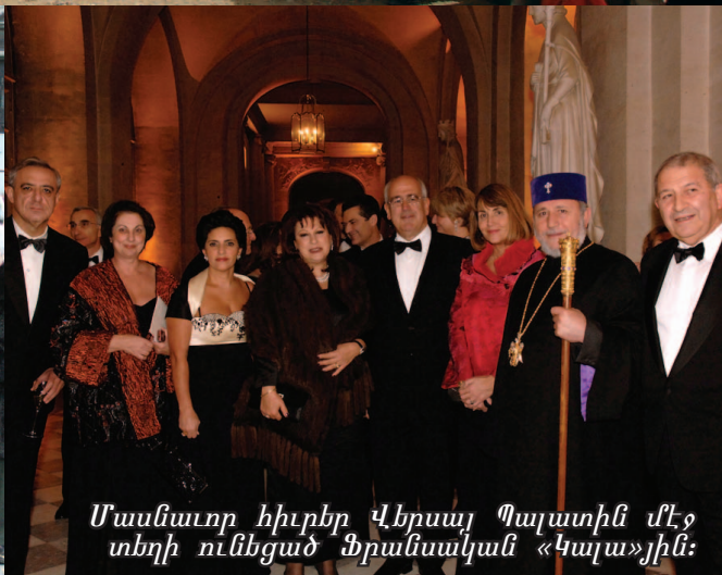
Մասնաւոր հիւրեր Վերսայ Պալատին մէջ տեղի ունեցած Ֆրանսական «Կալա»յին: