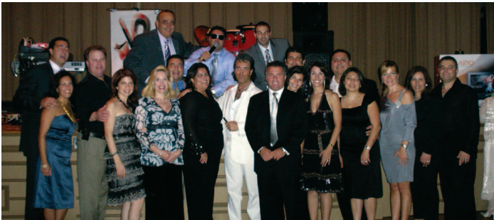
Նիւ Ինկլընտի Շրջանակը $15,000 կը հանգանակէ ՀԲԸՄի Ղարաբաղի Վերանակեցման Ծրագրին համար