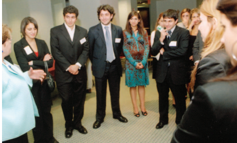
Նիւ Եորքի Ասպարէզային Փորձառութեան Ամառնային Ծրագիր

Երեւանի Ասպարէզային Փորձառութեան Ամառնային Ծրագրի (ԱՓԱԾ) անդրանիկ տարին (2007) աննախընթաց յաջողութեամբ պատկուեցաւ: 16 ուսանողներ Գանատայէն, Եգիպտոսէն, Ռումանիայէն եւ Միացեալ Նահանգներէն իջեւանեցան Երեւանի Պետական Համալսարանի հանրակացարանին մէջ եւ հինգ շաբթուայ ընթացքին մասնակցեցան մասնագիտական որակաւորման՝ Արտաքին Գործոց Նախարարութեան, Ազգային Ժողովի, Կեդրոնական Դրամատան, Հայաստանի Ամերիկեան Համալսարան, Գաֆէտեան Թանգարանի Հիմնարկութեան եւ շատ մը բժշկական հաստատութիւններուն բովը: Անոնք առիթը ունեցան վայելելու մայրաքաղաքի մշակոյթը, ներկայ գտնուեցան Հայոց պատմութեան դասախօսութիւններու եւ հանդիպեցան Հայաստանի Հանրապետութեան կառավարութեան ղեկավարներու հետ: Շարքավերջերուն այցելեցին երկրին պատմական ու տեսարժան վայրերը, ներառեալ յատուկ պտոյտ մը դէպի Ղարաբաղ, եւ մօտէն ծանօթացան ՀԲԸՄի ծրագիրներուն երկու երկիրներուն մէջ: Վերոյիշեալ փորձառութիւնները իրենց ընտանիքներուն հարորդեցին յատուկ պատրաստուած «պոյնթ»ի միջոցաւ: