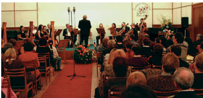
ՀԲԸՄ Սոֆիայի Սենեկային Նուագախումբի համերգ, Փետրուար 2007