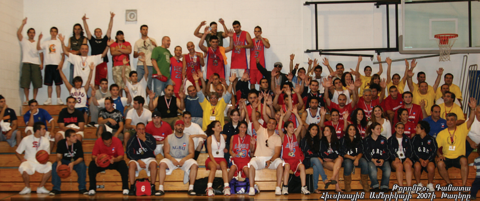
Թորոնթո, Գանատա Հիւսիսային Ամերիկայի 2007ի Խաղերը