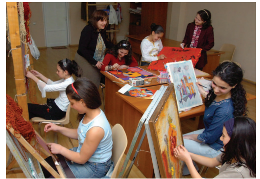
Նկարչութեան դաս ՀԲԸՄի Հայորդեաց Կեդրոններուն մէկէն մերս

Նորաստեղծ Ղարաբաղի Հանրապետության մէջ երաժշտական մշակոյթ տարածելու առաջնութիւնը շարունակելով, Ղարաբաղի Սենեկային Նուագախումբը (ՂՄՆ), խմբավար Գեորգ Մուրատեանի ղեկավարութեամբ, բազմաթիւ համերգներ տուաւ վերջին երկու տարիներու ընթացքին եւ այդպիսով շուտով համրաւի տիրացաւ իբր Հարաւային Կովկասի լաւագոյն սենեկային նուագախումբերէն մին, որու հետեւանձնով արտասահմանէն համերգ տալու այլեւայլ հրաւերներ ստացաւ: ՂՄՆի յիշարժան ելոյթներէն կարելի է նշել անոր մասնակցութիւնը Երեւանի մէջ 2006ի ամառը կայացած «ՄԷԿ Ա.գգ, ՄԷԿ Մշակոյթ» փառատօնին, ինչպէս նաեւ յատուկ այն համերգը, որ կազմակերպուած էր ղեկավար Եղուարդ Միրզայեանի 85րդ տարեդարձի առթիւ: 2006ին, Ղարաբաղի Երաժշտական Դպրոցի վարչութեան հետ, Մուրատեան երաժշտական գոլէն մըն ալ հաստատեց, ուր կ'ուսանին ապագայի արհեստավարժ երաժիշտներ: