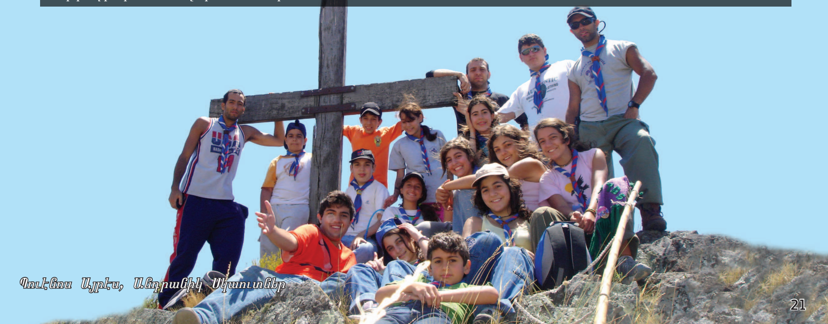
Պուէնտա Այրէս, Անդրանիկ Սկաւտներ

Միութեան գրեթէ ութսուն տարի առաջ հիմնուած սկաւտական ծրագիրը կարգապահութիւն, խիզախութիւն եւ յարատեւելու հմտութիւն կը տրվեցնէ հայ պատանիներու, որոնք կը սկսին իրր գայլիկ կամ արծուիկ եւ կը յառաջանան մինչեւ որ դառնան խմբավար: Աշխարհասփիւռ այս խումբերէն շատերը տարեկան պտոյտներ կը կազմակերպեն ամրան եւ կամ ձմեռան ընթացքին՝ վարժութիւն ձեռք բերելու, ջոկատի անդամներու միջեւ եղող կապը զօրացնելու եւ ամառայնութեամբ շրջապատուած միջավայրը վայելելու նպատակով: Պուէնտա Այրէսի «Անդրանիկ» խումբը ուղեւոր իրագործեց, նշելով իր 20-ամեակը Յունիս 2006ին անկի բան 500 կողմնակիցներու ներկայութիւն վայելող յատուկ ձեռնարկով: Մոնթրէալի սկաւտներն ալ, իրենց ընկերներու կողմէ բարձր գնահատանքի արժանացան Մայիս 2007ին տեղի ունեցած Մետրոպոլիտ Մոնթրէալի Սկաւտներու «Կալա ըվ Էֆսէլլընս»ին, բազմաթիւ մրցանակներ շահելով: Ատոնցմէ մին է ցանկալի «Ինուֆշուֆ» մրցանակը, որ կը տրուի առաջ սկաւտներուն, որոնք «Վենչրըքս» (Վտանգաւոր, 16էն 18 տարեկան) կը կոչուին եւ որոնք եզակի իրագործում մը կատարած են, որ ամբողջ սկաւտական շարժման կրնայ ծառայել իրր գերազանցութեան տիպար: Մոնթրէալի Վտանգաւորները «Ինուֆշուֆ» պատիւին արժանացան դէպի Հայաստան կատարած իրենց երկրորդ մարդասիրական առաքելութեան համար: