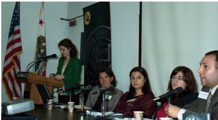
Հայ Կին կը կազմակերպէ: «ԱՄՆի Հայ Համայնքներու Գոյակիւնակը» նիւթին նուիրուած գիտաժողով