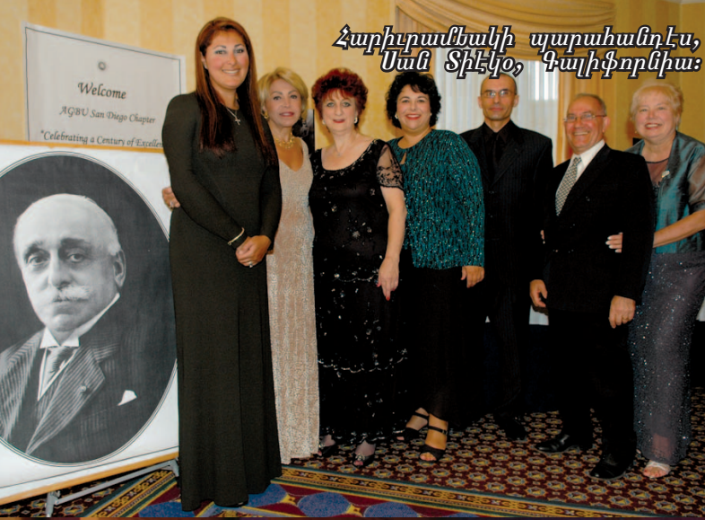
Հարիւրամեակի պարահանդէս, Սան Տիէյօ, Գայիֆորնիա: