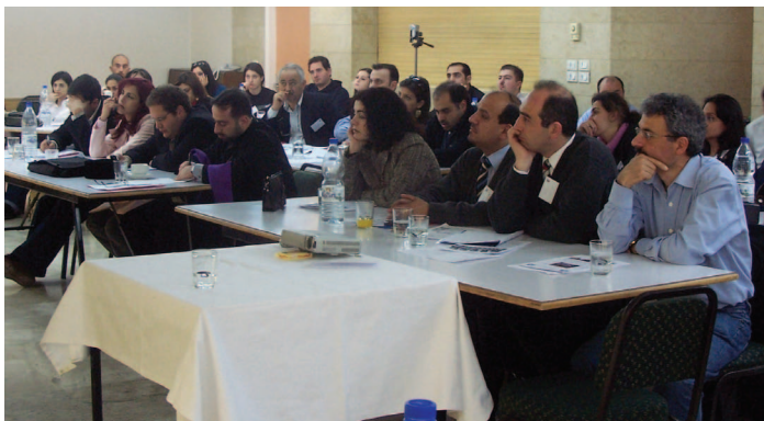
Մարտ 2006ին Դամասկոսի Մասնաճիւղի կողմէ կազմակերպուած «Լրագրութիւնն ու Լրատուական Միջոցները» կոչուած երկու օրուայ սեմինարը

Այն գիտակցութեամբ թէ կրթութիւն ստանալը, տարիքէն անկախաբար, մարդկային պահանջք մըն է, ՀԲԸՄԻ Մասնաճիւղերը դասախօսութիւններ եւ համաժողովներ կազմակերպեցին, իրենց անդամներու միտքերը զարգացնելու նպատակով: