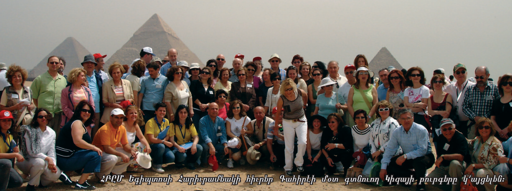
ՀԲԸՄ Եգիպտոսի Հարիւրամեակի հիւրեր Գահիրէի մօտ գտնուող Կիգայի բուրգերը կ'այցելեն: