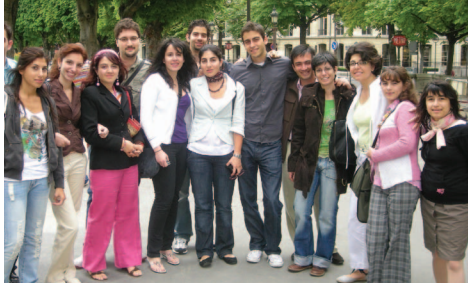
Փարիզի Ասպարէզային Փորձառութեան Ամառնային Ծրագիր