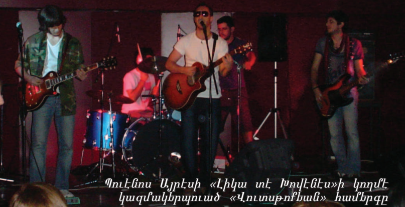
Պուէնոս Այրէսի «Լիկա տէ Խովէնէս»-ի կողմէ կազմակերպուած «Վուսթօքսան» համերգը